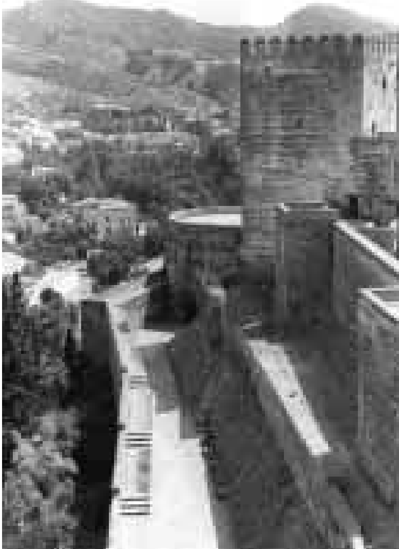
أسوار قلعة المدور